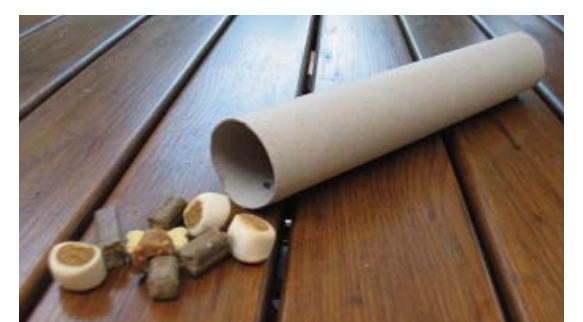
Eine ganz einfache Beschäftigung stellt man mit einer alten Küchenrolle und ein paar Leckerlies her. Futter hinein in die Röhre und die beiden Enden zugefaltet.