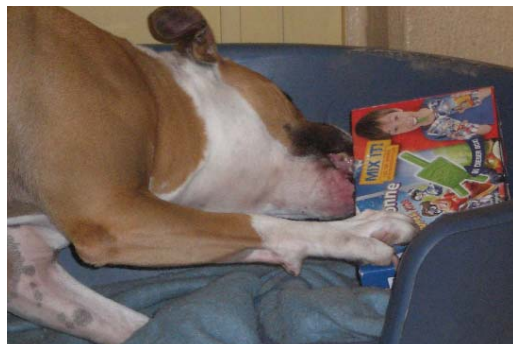
Pappkartonschachteln mit Zeitungspapier gefüllt und zwischendurch Leckerlies, eignen sich perfekt zum Zerstören.