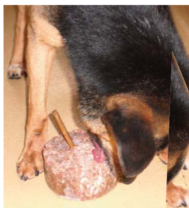
Das mit sehr viel Wasser verdünnte Dosenfutter wird zu einem Eisblock gefroren. Schon ist das leckerste Eis am Stiel fertig!

Eine in der Herstellung sehr aufwendige Beschäftigungsmöglichkeit ist eine „Pinacolada“.