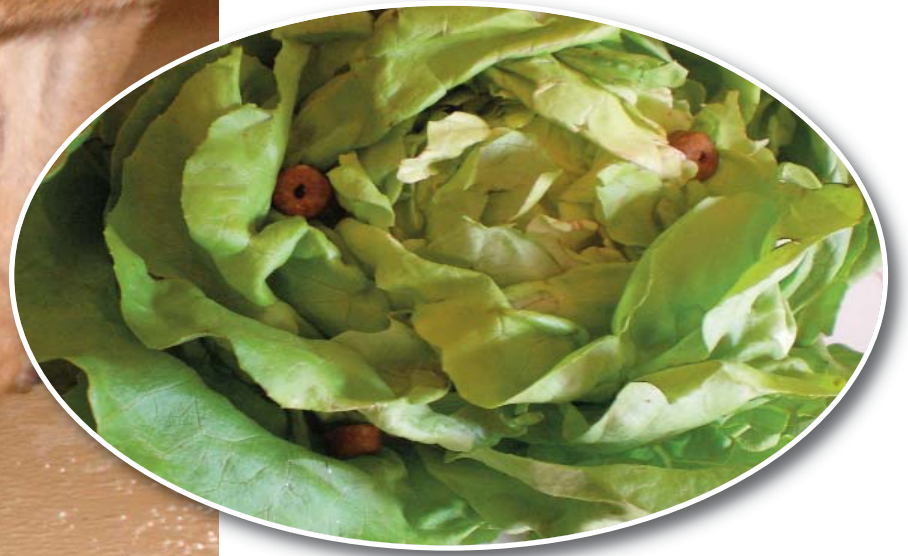
Kopfsalat mit einigen Frolic-Ringen gespickt, macht Hunden riesigen Spaß und stillt den Heißhunger auf Gras.